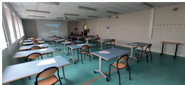
La salle qui accueillera la première Newton Room permanente au sein du collège Félix Landreau à Angers

Jusqu'à présent en France, ce sont les salles mobiles qui ont été déployées afin de faire connaître le projet. Mais l'enjeu est que les expériences mobiles donnent ensuite lieu à la construction d'une salle permanente. C'est ainsi le cas à Angers où suite à l'expérience réussie de la Newton Mobile en mai 2021, de nombreux acteurs locaux ont manifesté leur intérêt pour accueillir une salle permanente. C'est ainsi qu'au printemps 2022, la première Newton Room permanente en France ouvrira au collège Félix Landreau. Elle accueillera les modules «Robots et Circonférences» et «Explorons l'énergie» et sera ouverte aux classes des collèges et écoles primaire du territoire.