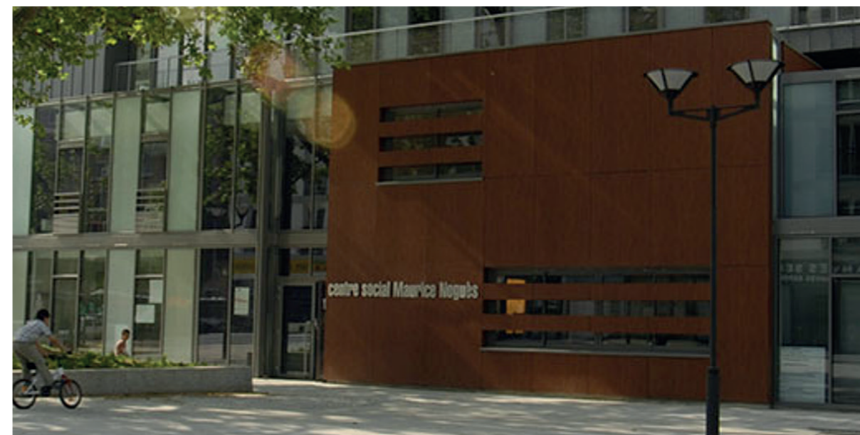
La centre socioculturel Maurice Noguès

À Paris c'est le lien fort et historique entre le centre social Maurice Noguès et la cité scolaire Villon qui a permis de lancer le projet. Géré depuis plus de 12 ans par Léo Lagrange Nord Île-de-France, il a pour vocation de « répondre aux besoins et aux envies des habitants, des plus jeunes aux plus âgés, du quartier politique de la ville Didot – Porte de Vanves ». Pour répondre à cet objectif et en raison de la proximité avec le collège Villon, les deux acteurs organisent souvent des activités en commun, permettant ainsi de croiser l'héritage et la méthodologie de l'éducation populaire à celle de l'éducation nationale.