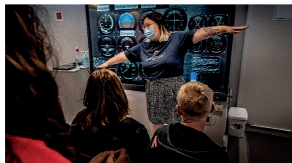
Une instructrice de vol Léo Lagrange présente le pilotage à un groupe de jeunes

À l'issue de cette phase pilote, près de 94 % des participants déclaraient avoir été « très satisfaits » ou « satisfaits » de leur passage dans la Newton. Mieux, 83 % des répondants déclaraient avoir « beaucoup appris » sur les mathématiques grâce à l'enseignement concret et immersif dans la Newton.