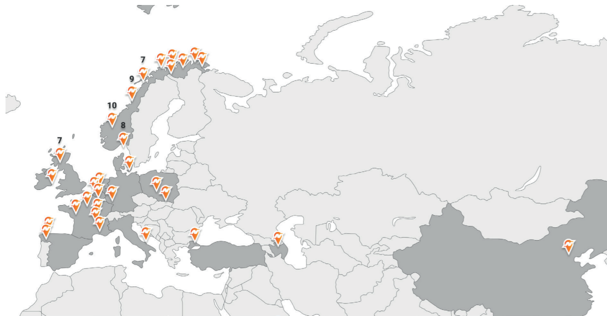
Implantations des différentes salles Newton en Norvège et en Europe

La première Newton Room internationale a ouvert en 2015 au Danemark et deux autres Newton Rooms ont été établies en Écosse en 2019. À ce jour, des installations ont été réalisées avec succès en Pologne, en Espagne, en Allemagne, en Belgique, en Italie, en Turquie et en France.