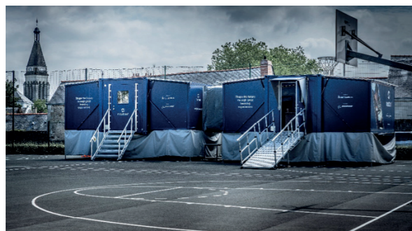
La Newton Room est installée sur le terrain de basket du collège Renoir à Angers (mai 2021)

Depuis 2021, la Newton Room Mobile s'est déployée dans trois territoires différents. La première expérimentation a eu lieu au collège Jean et Auguste Renoir à Angers en mai 2021. Elle a concerné 364 élèves de 5e à la 3e pour 90 heures de modules.