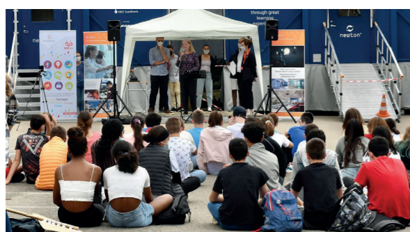
La cérémonie de présentation du projet Newton au collège Le Parc à Dijon (juillet 2021)

En juin 2021, c'est donc le collège Le Parc à Dijon qui a été choisi pour accueillir la salle Newton pendant un mois puis le collège Elsa Triolet à Vénissieux pendant les vacances d'été.