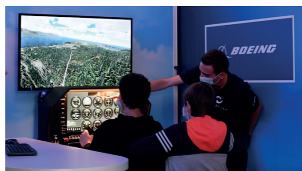
Un enseignant de l'éducation nationale présente le pilotage à un groupe de jeunes du collège Elsa Triolet de Vénissieux (juin 2021)

Au total sur près de quatre mois d'expérimentation, ce sont ainsi plus de 800 jeunes ont pu bénéficier de 234 heures de modules Newton. Et là encore, les retours ont été très positifs, à la fois du côté des élèves (97 % d'entre eux trouvant l'enseignement dans la Newton « passionnant » ou « intéressant ») que des enseignants (100 % d'entre eux déclarant vouloir recommander la Newton Room à leurs collègues).