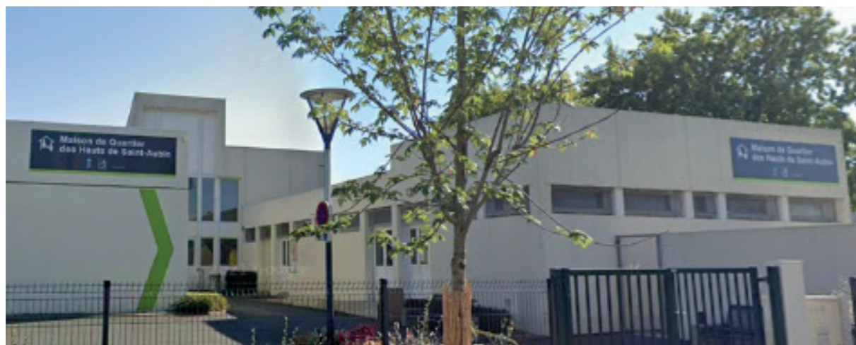
La maison de quartier des Hauts de Saint Aubin

Forte de son implantation territoriale nationale, la Fédération s'est ainsi appuyée sur ses partenariats locaux avec différents collèges et partenaires pour mettre en place le projet. La première Newton Room mobile a ainsi ouvert ses portes au collège Renoir à Angers en mai 2021 en lien avec la maison de quartier des Hauts-de-Saint-Aubin, gérée par Léo Lagrange Ouest.