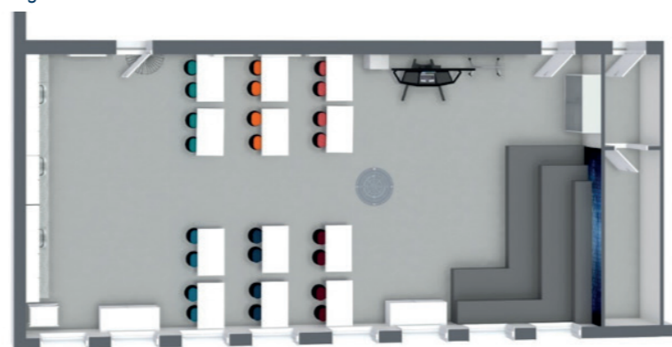
Le plan de la future Newton Room permanente d'Angers

D'autres projets d'installation de Newton Room Permanentes sont en cours, notamment à Dijon mais aussi dans le méditerranée et dans le sud-ouest de la France.